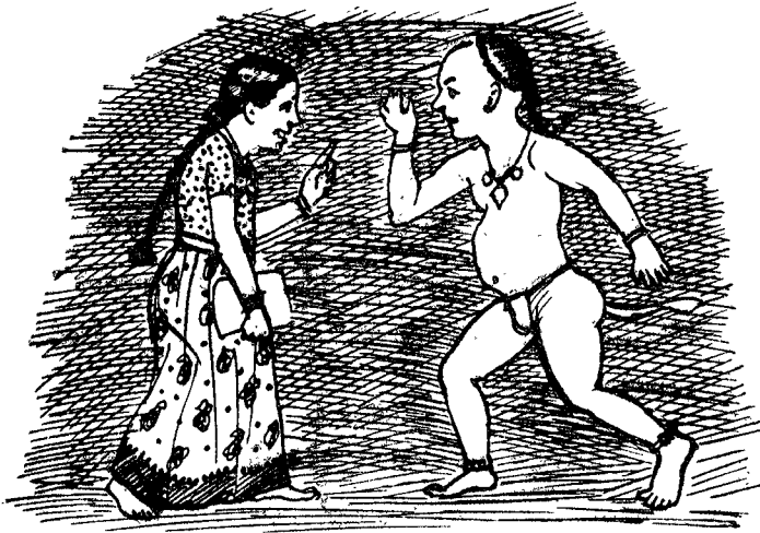
“ శ్రీ నీది కాదా యేమిటి ? ”

రంగమ్మ రంయిన వెనుదిరిగి యిటు లనెను— ‘శ్రీ నీది కాదా యేమిటి?’