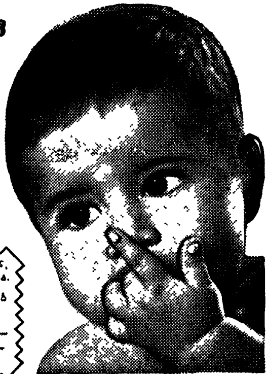
PYG. 16-X08 TL