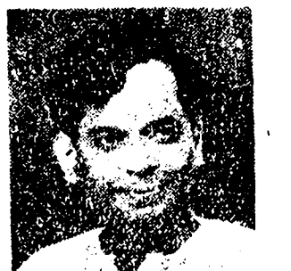
అయిన మార్గశిరషి మాసం అయినప్పుడు వారు వ్రాసిన వాక్యాలు ప్రకటింపబడ్డాయి.