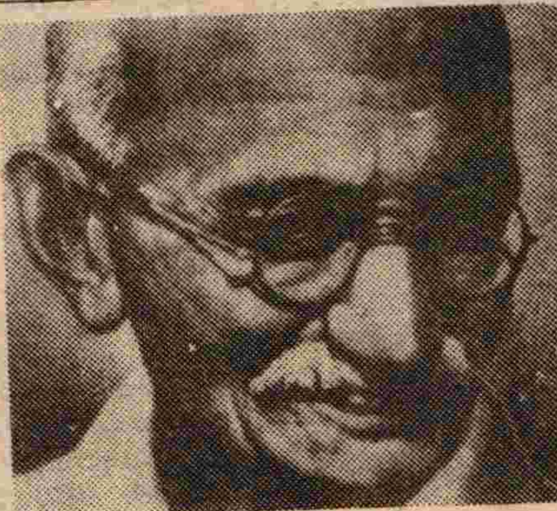
మర్యాదలు మన చేతుల్లోనే ఉండాలి. మన చేతితో వడికిన నూలుతో తయారైన ఖద్దరు వస్త్రాలే ధరింపవలెను" అని అన్నారు.

ఈ ప్రశ్న విని అక్కడ ఉన్న వా రందరూ న్నబ్బులైపోయారు. ఆమె చకితురాలై తన వంటి వైపు చూసుకుంది. చినిగిన, అతుకుల బొంత కాదు తను కట్టుకున్న చీర. ఖరీదైనది, కొత్తది కూడా. ఎవరికీ గాంధీగారి అంతరార్థం అర్థం కాలేదు. చివరకు గాంధీ గారు ఇలా అన్నారు - "నా ప్రశ్న మీకు అర్థం కాలేదు కదా? మీ బుద్ధి జడమైపోయింది. ఈ సోదరి ధరించిన వస్త్రాలన్ని విదేశీ వస్త్రాలు కదా? అనగా ఈనాడు మన స్త్రీల మాన మర్యాదలను కాపాడేవి విదేశీ వస్త్రాలే కదా? ఒకవేళ రేపు విదేశాల నుండి వస్త్రాలు దిగుమతి కాకపోతే మన స్త్రీల మాన మర్యాదలు కాపాడటం ఎలా? ఇతరుల మీద ఆధారపడి ఉండే వారు దిగంబరుల క్రింద జమయే. మన మాన