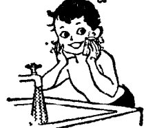
హమాం వారికి ఎంతో