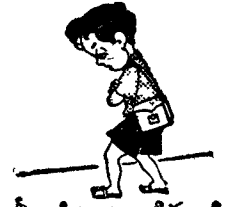
మీ పిల్లలు బడినుండి