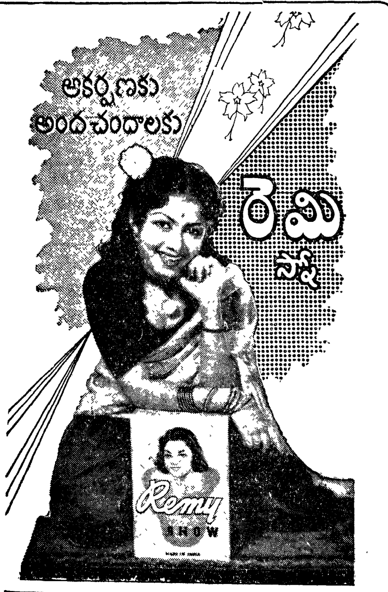
ఆంధ్రపబ్లికేషన్లు: మెనర్యు ఏ ఆర్. (చేకపబ్లికేషన్స్, విజయవాడ.

చెఱువువైపు నుంచి వస్తూనే తాతయ్య అన్నాడు- “ఆవాల వెంకన్నేరా వీడు! ఎలా గయితే ఎనిమిది రూపాయలు కక్కాడులే! బతిమలాశితే రెండు రూపాయలు వొదిలేశారు. నిన్నటి ముప్పిది - వాడి వెళ్లామే! మొగుడూ వెళ్లం కూతుళ్లు గట్టుకింద పండుకుంటున్నారు. ★