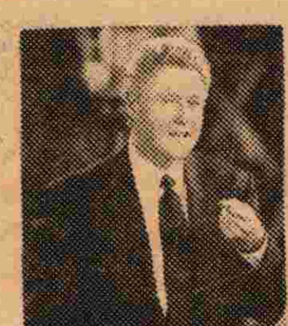
క్లింటన్ గారు తడబడిన విధం బెట్టిదనిన..

"ఇదుగో! 'బలరామయ్య మంచి పని చేశాడలేవే! మంచి సంబంధం రాగానే ముందు ఖర్చు గురించి ఆలోచించకుండా పెళ్లి చేశాడు. ఇంక మీకు భారం తీరినట్లే. అందునా విదేశాల అల్లుడాయె. కూతుర్ని పువ్వుల్లోనే ఉంచుతాడు. దిగులేలేదు' అని అందయ్యా!" అని కూతుర్ని చూసి "బంగారంలాంటి బిడ్డ. అదృష్టం వెతుక్కుంటూ వస్తుంది" అని ఇరుగు దిప్తి పొరుగు దిప్తి తీరేంత దాకా మెటికలు వినిచింది.