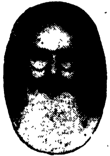
వైద్యభాస్కర సారథీస్ హెయిర్ టానిక్

ఆయుర్యేదపద్ధతులపై తయారుకాబడిన ఔషధ రాజము. కుదుళ్ళను గట్టి పరచి కురులను, నల్లగా, గుబురుగా నిడివిగా పెంచును. నెరవనీయదు — రాలనీయదు