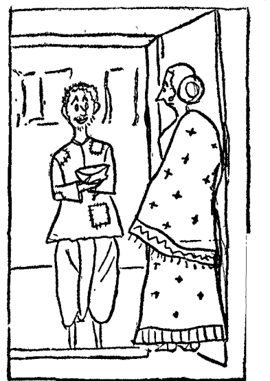
"అమ్మా, బంగళదుం వేపదం చేసుకుంటే కొంచెం పెడతారూ....."

సింగన్న యుద్ధం అనే మాట విని, ఉరిక్కి పడ్డాడు. అతని అన్న ఒకడు యుద్ధంలోనే చచ్చి పోయాడు. అతని తల్లి యుద్ధంలో బల్లె పోయిన పెద్దకొడుకును గురించే దిగులుపడి కళ్ళు పోగొట్టుకుని ఆ వ్యధతోనే చచ్చింది. ఇప్పుడు నుళి యుద్ధమా ? సింగన్న ఆధర్