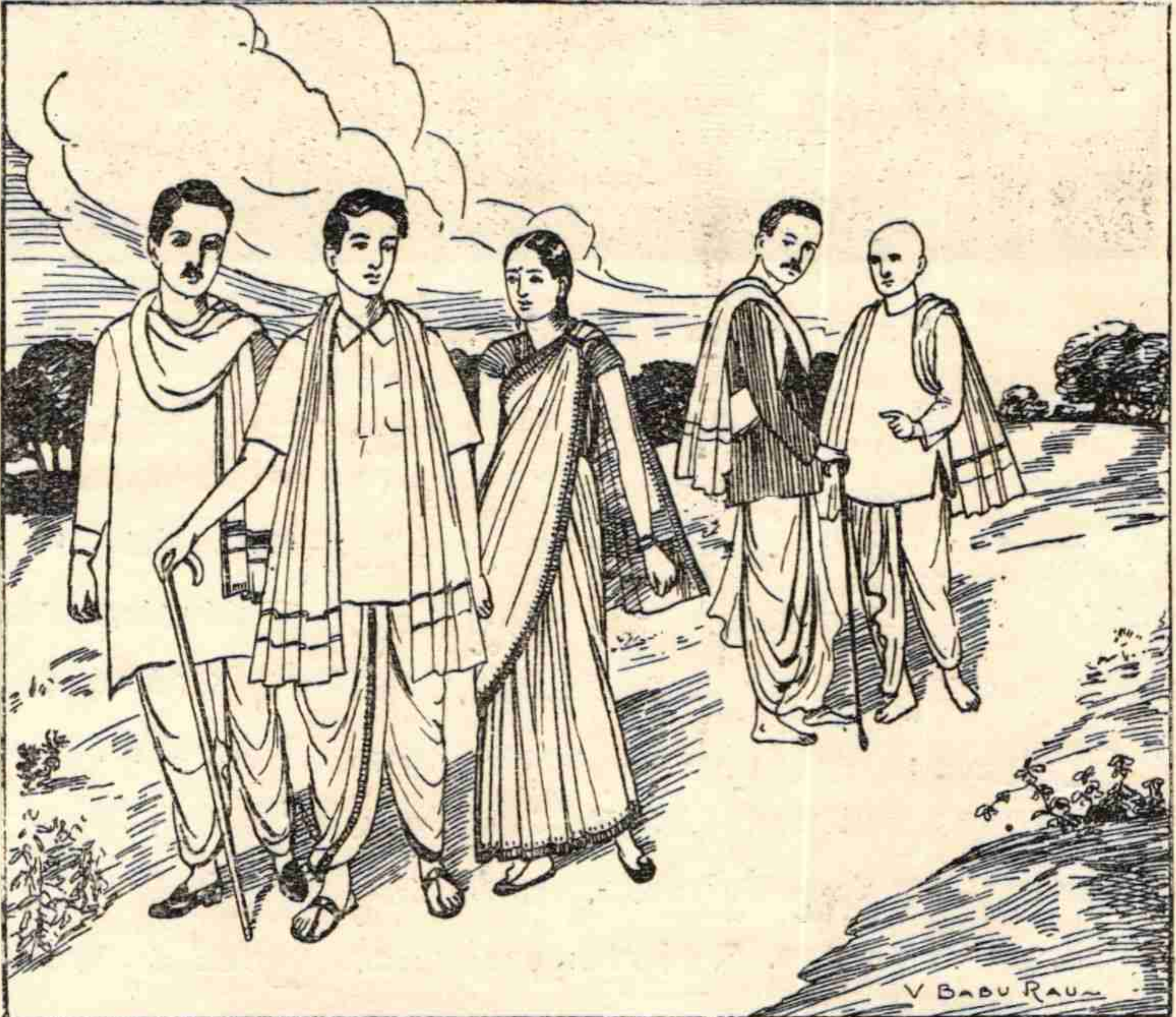
“మమ్ము కడగంట.....గుసగుస లారంభమయినవి.”

“ఇట్లు కొన్నాళ్లుగడచినవి. నేను ప్రతిఉదయమున మాసీతతో గూడ కొంతమూరము నడచివచ్చుట వాడుకజేయుచుంటిని. వైద్యు డప్పుడప్పుడు మమ్ముగలసి